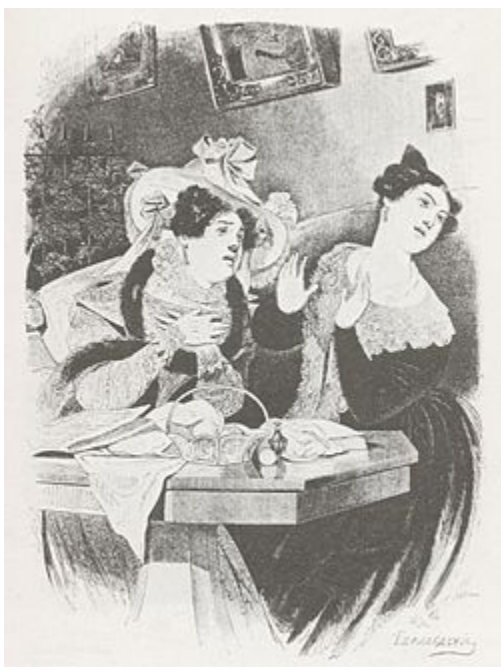
Иллюстрация А. Агина

Поутру, ранее даже того времени, которое назначено в городе N для визитов, из дверей оранжевого деревянного дома с мезонином и голубыми колоннами выпорхнула дама в клетчатом щегольском клоке, сопровождаемая лакеем в шинели с несколькими воротниками и золотым галуном на круглой лощеной шляпе. Дама вспорхнула в тот же час с необыкновенною поспешностью по откинутым ступенькам в стоявшую у подъезда коляску. Лакей тут же захлопнул даму дверцами, закидал ступеньками и, ухватясь за ремни сзади коляски, закричал кучеру: «Пошел!» Дама везла только что