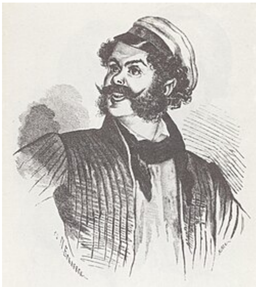
Ноздрев (илл. П. Боклевского)

бараньей печенки спросит, и всего только что попробует, а Собакевич одного чего-нибудь спросит, да уж зато всё съест, даже и подбавки потребует за ту же цену.