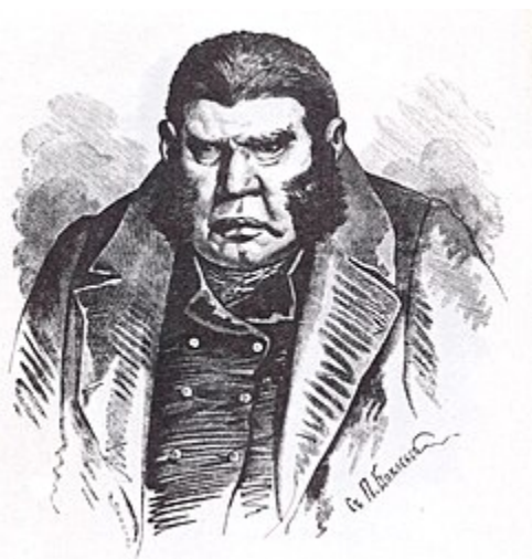
Собакевич (илл. П. Боклевского)

ухватливого двадцатилетнего парня, мигача и щеголя, и подмигивающего, и посвистывающего на белогрудых и белошейных девиц, собравшихся послушать его тихострунного треньканья. Выглянувши, оба лица в ту же минуту спрятались. На крыльцо вышел лакей в серой куртке с голубым стоячим воротником и ввел Чичикова в сени, куда вышел уже сам хозяин. Увидев гостя, он сказал отрывисто: «Прощу!» — и повел его во внутренние жилья.