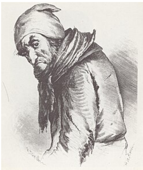
Плюшкин (илл. П. Боклевского)

Здесь герой наш поневоле отступил назад и поглядел на него пристально. Ему случилось видеть немало всякого рода людей, даже таких, каких нам с читателем, может быть, никогда не придется увидеть; но такого он еще не видывал. Лицо его не представляло ничего особенного; оно было почти такое же, как у многих худощавых стариков, один подбородок только выступал очень далеко вперед, так что он должен был всякий раз закрывать его платком, чтобы не заплевать; маленькие глазки еще не потухнули и бегали из-под высоко выросших бровей, как мыши, когда, высунувши из темных нор остренькие морды, насторожа уши и моргая усом, они высматривают, не затаился ли где кот или шалун мальчишка, и нюхает подозрительно самый