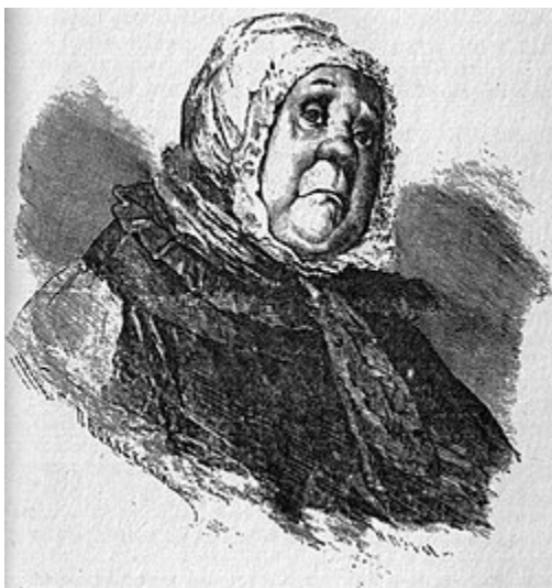
Коробочка (илл. П. Боклевского)

Ворота отперлись. Огонек мелькнул и в другом окне. Бричка, въехавши на двор, остановилась перед небольшим домиком, который за темнотою трудно было рассмотреть. Только одна половина его была озарена светом, исходившим из окон; видна была еще лужа перед домом, на которую прямо ударял тот же свет. Дождь стучал звучно по деревянной крыше и журчащими ручьями стекал в подставленную бочку. Между тем псы заливались всеми возможными голосами: один, забросивши вверх голову, выводил так протяжно и с таким старанием, как будто за это получал Бог знает какое жалованье; другой отхватывал наскоро, как пономарь; промеж них звенел, как почтовый звонок, неугомонный дискант, вероятно молодого щенка, и все это, наконец, повершал бас, может быть, старик,