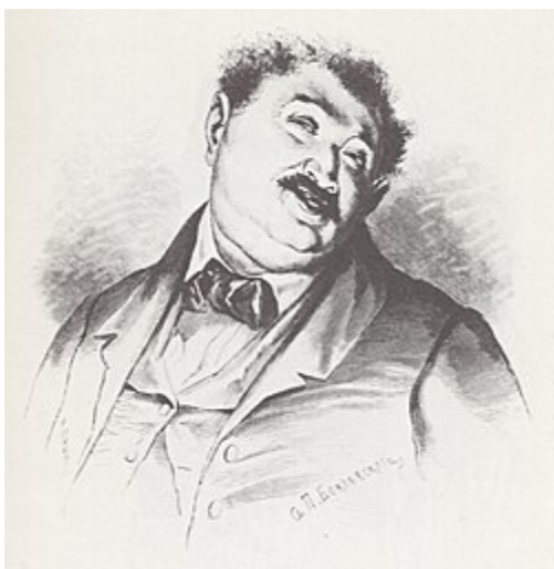
Манилов (илл. П. Боклевского)

изображать характеры большого размера; там просто бросай краски со всей руки на полотно: черные палящие глаза, нависшие брови, перерезанный морщиною лоб, перекинутый через плечо черный или алый, как огонь, плащ — и портрет готов; но вот эти все господа, которых много на свете, которые с вида очень похожи между собою, а между тем как приглядишься, увидишь много самых неуловимых особенностей, — эти господа страшно трудны для портретов. Тут придется сильно напрягать внимание, пока заставишь перед собою выступить все тонкие, почти невидимые черты, и вообще далеко придется углублять уже изощренный в науке выпытывания взгляд.